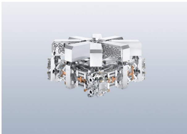
레이저 테크놀로지 Laser Technology