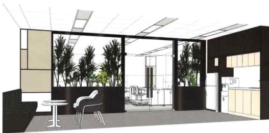
비즈니스 라운지 공간 A (예시)