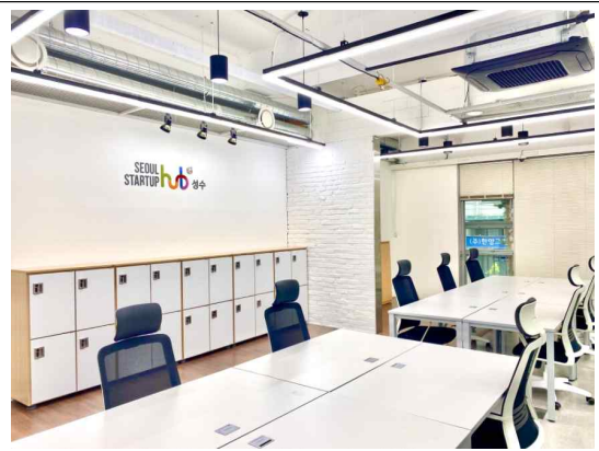
사무실 공간 2