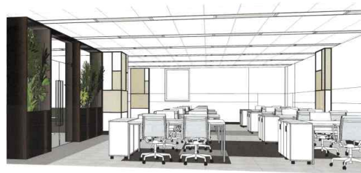
사무실 공간 A (예시)