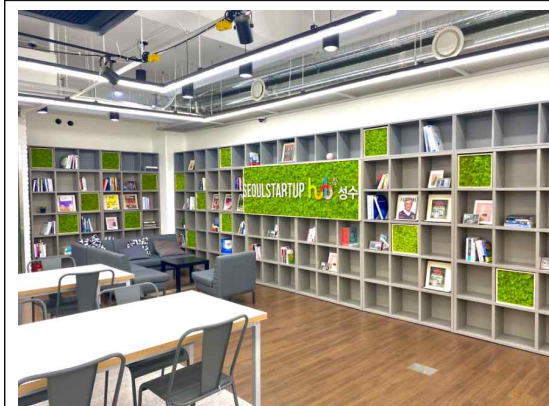
비즈니스라운지 공간 2