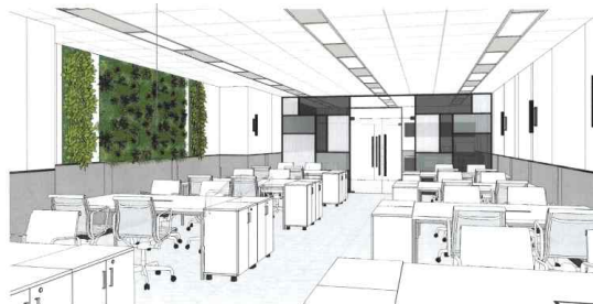
사무실 공간 B (예시)