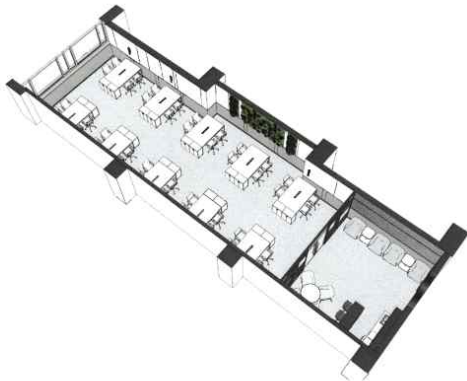
사무실 공간 B (예시)