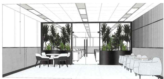
비즈니스 라운지 공간 B (예시)