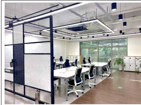
사무실 공간 1

- 주소 : 성동구 성수이로22길 37 2층, (성수역 2번 출구 인근)