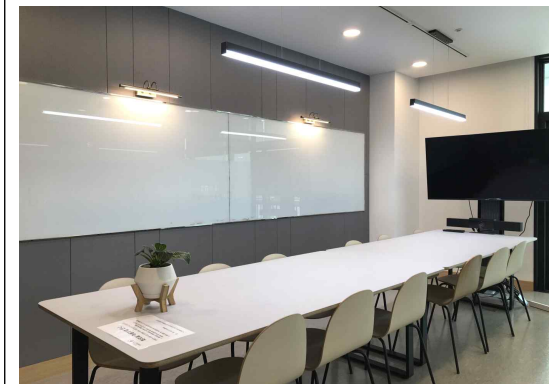
회의실 공간 1