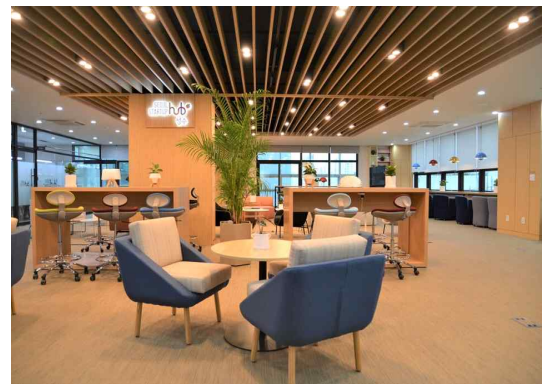
비즈니스라운지 공간 1