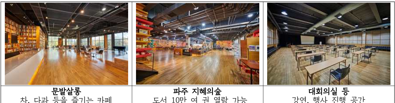
문발살롱 차, 다과 등을 즐기는 카페