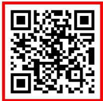
[ FLEX 수험서 구입 ]